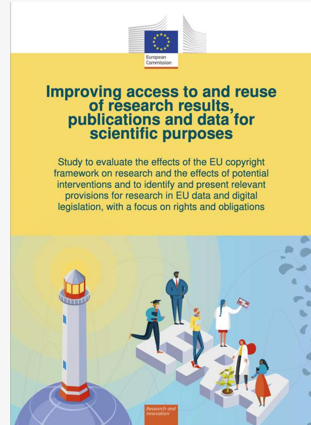
Le rapport de la Commission européenne (DG RTD)